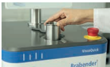
繰り返し使用可能なSUS製測定ボウル