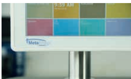
Webベースソフト MetaBridgeとタッチパネルによる直観的操作